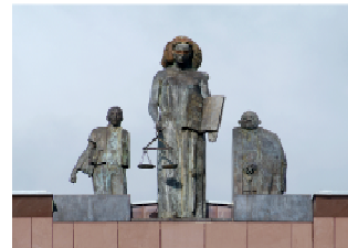
Darmstädter Juristische Gesellschaft